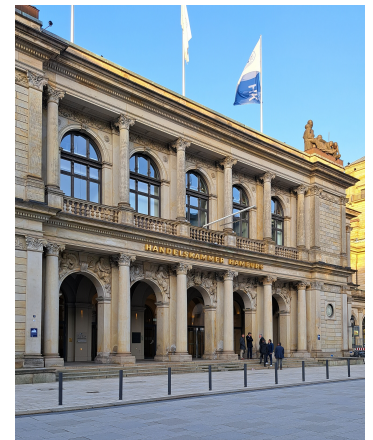
Handelskammer Hamburg

14.00 - 15.30 Uhr Eröffnungsveranstaltung Begrüßung: Marcus Troeder (Handelskammer Hamburg) Aktuelle Herausforderungen im Einzelhandel Podiumsdiskussion mit Britta Mohr-Rothe (IKEA Deutschland GmbH & Co. KG Niederlassung Hamburg-Altona), Conrad Hasselbach (Conrad Hasselbach Shoes & Garment), Denise Rathgeber (Dössel & Rademacher oHG) Moderation: Heiner Schote & Cordula Neiberger