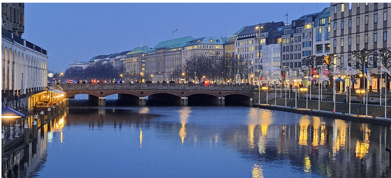
Die Hamburger Innenstadt, im Vordergrund die Kleine Alster

Steindamm 63 20099 Hamburg (St. Georg) Tel. 040 241 929-0 Zentrale Reservierung: 030 40 50 46 200 rubin@arcotel.com