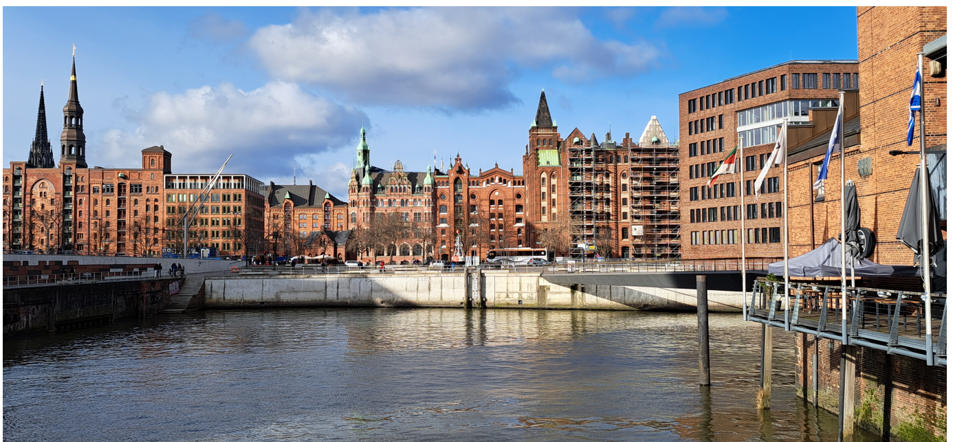
Speicherstadt in Hamburg sowie die Hauptkirchen St. Nikolai und St. Katharinen