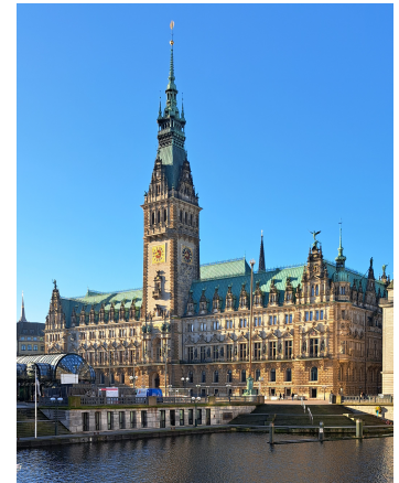
Das Hamburger Rathaus

vor dem Hotel Graf Moltke, Steindamm 1, 20099 Hamburg (3 Minuten vom Hauptbahnhof entfernt)